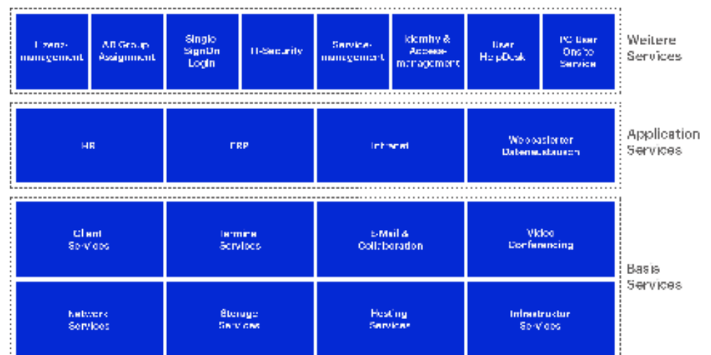
Abb. 2: Servicemodule

Das Full-Service-Paket der matrix beinhaltet neben den zentralen Basisdiensten verschiedene Anwendungen und weitere Services: